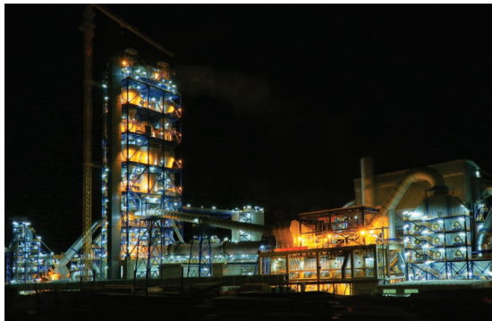
《阿尔及利亚BISKRA项目夜景》—管理团队:曹新明