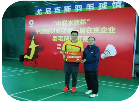
集团领导为公司颁发“优秀组织奖”