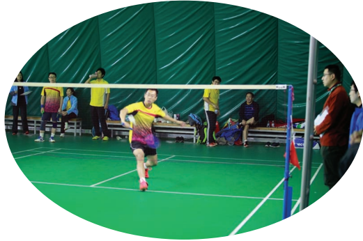
公司羽毛球队员在比赛中